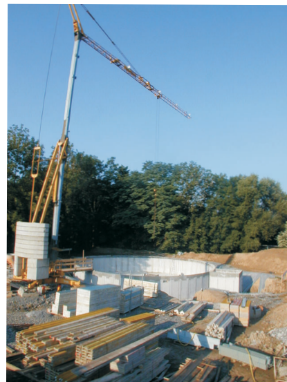
Becken mit Baustelleneinrichtung