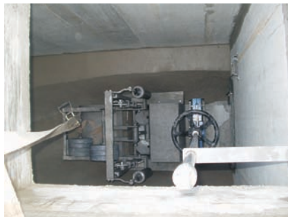
Drosselschacht und Ablaufschacht