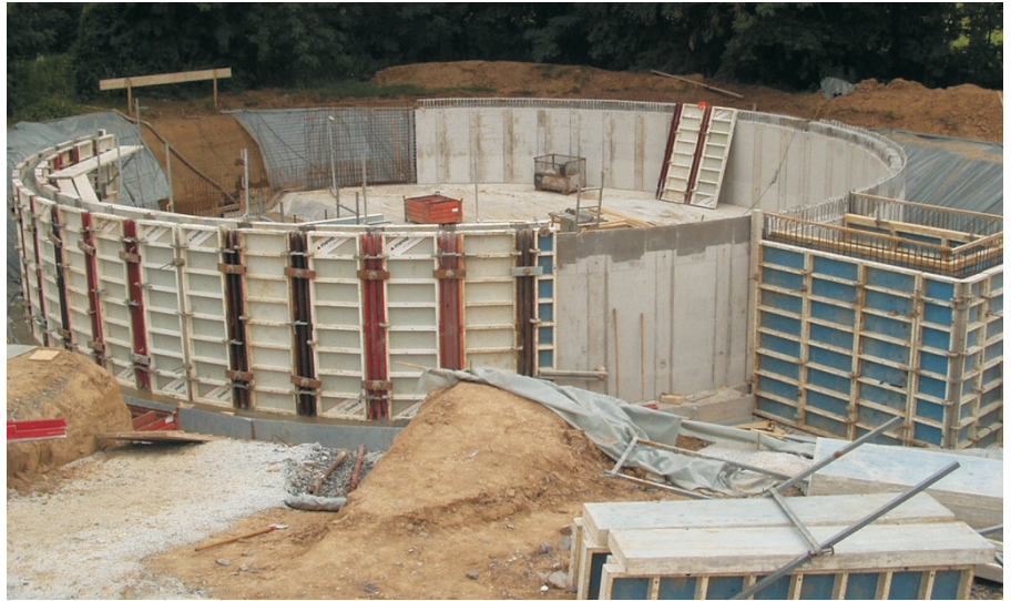
Schalung der Wände