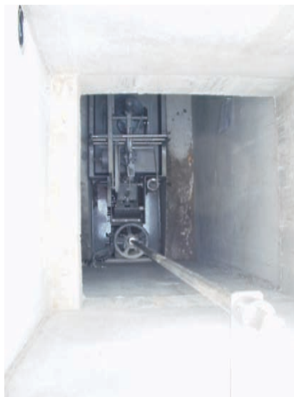
Drosselschacht mit Drosselorgan