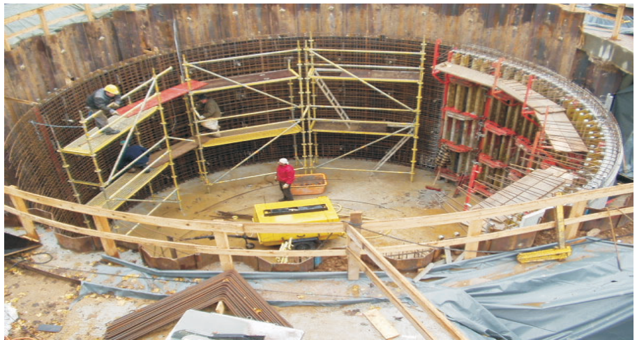
Spundwand mit Kopfbalken, Wandbewehrung