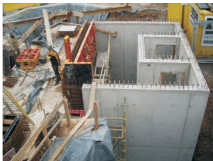
Entlastungsbauwerk mit Hochwasser-Schieber