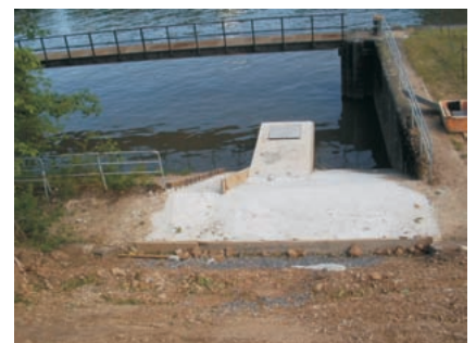
Entlastungskanal in Neckar