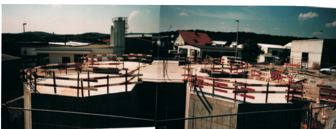
Betonierung der Decken